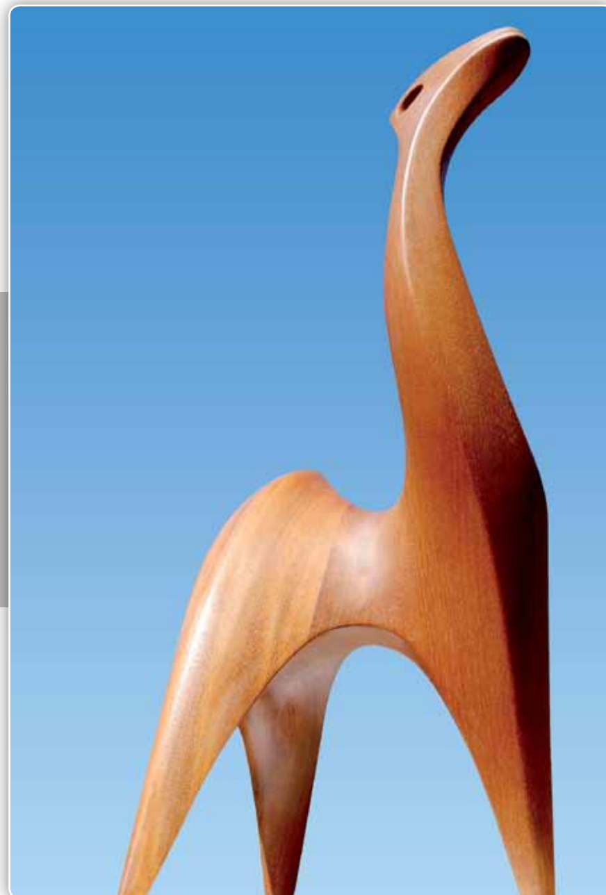
11.- Trino Saurio - Madera de Caobilla - 138x70x70 - 1998