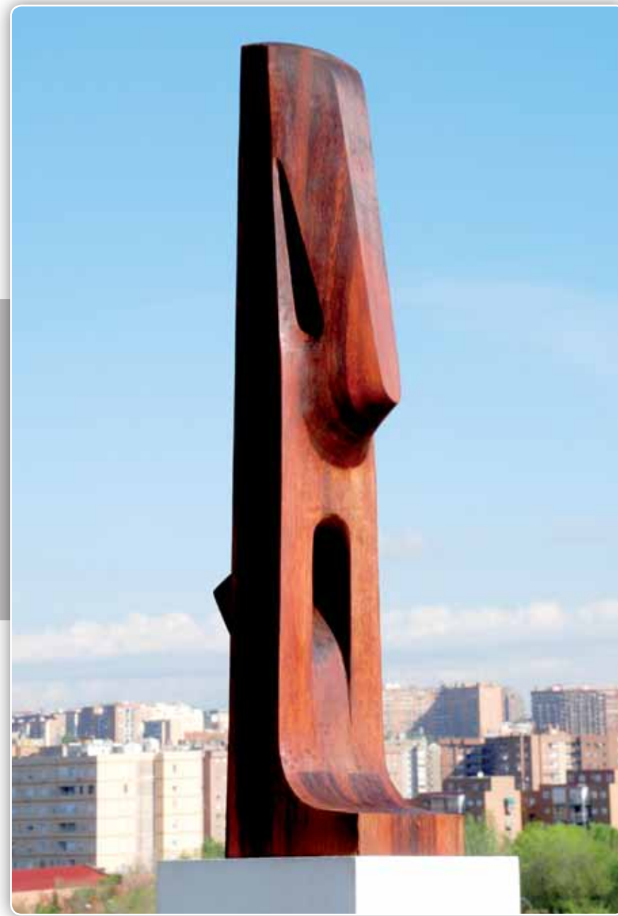
15.- Serie Totems - Madera Etimoe - 1005x20x18 cm - 2012