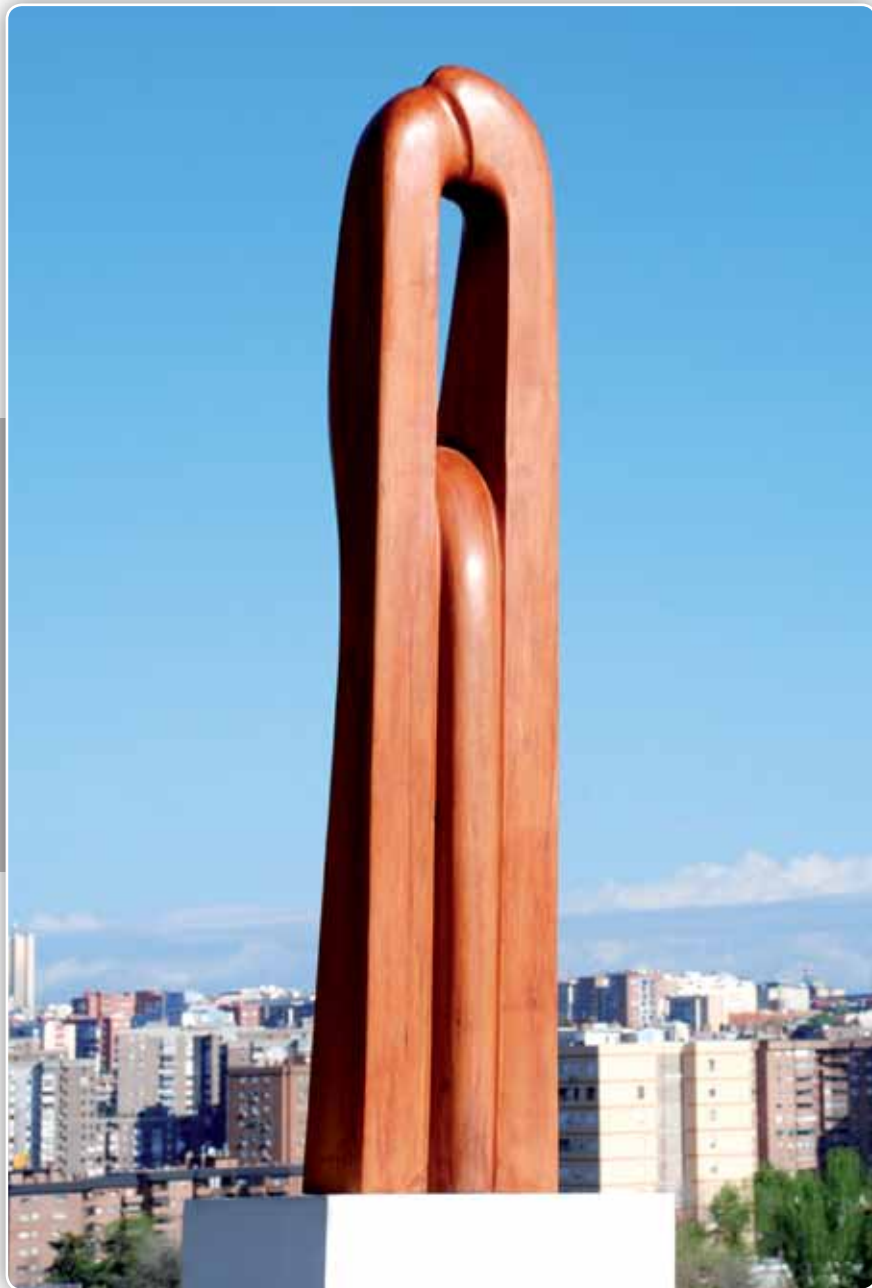
16.- Serie Totems - Madera de Etimoe - 112x35x21 cm - 2012