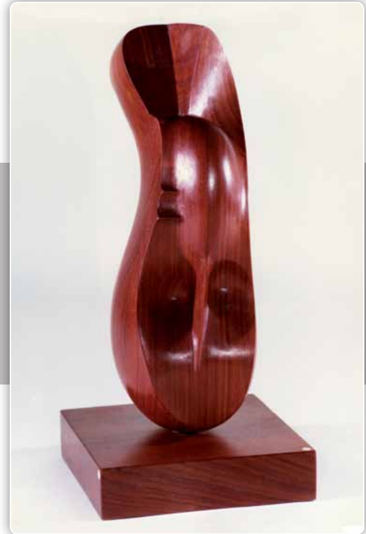
5.- Serie Orgánica - Madera palo rojo - 72x32x32 cm - 1974