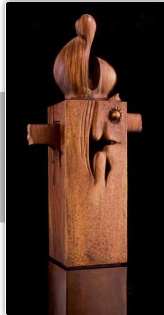
9.- Serie Germinaciones - Madera de caobilla - 180x40x70 cm - 1996