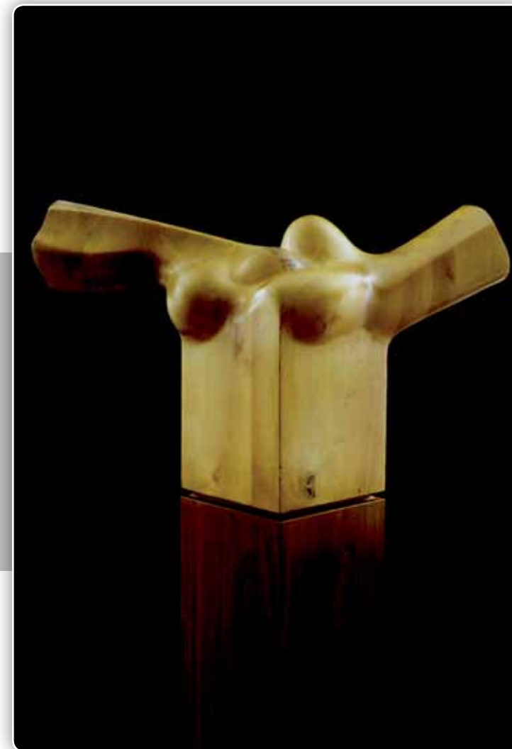
3.- Serie Osamentas - Madera de nogal - 44x64x30 cm - 1979