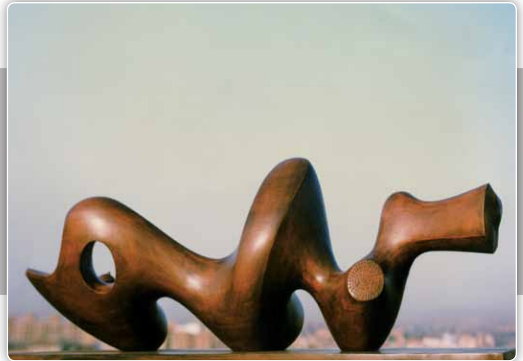
13.- Serie Orgánica - Madera de caoba teñida - 122x32x45 cm - 1996