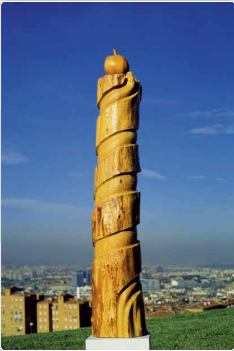
12.- Manzana de Eva - Madera de Ciprés - 137x28x28 cm - 1988