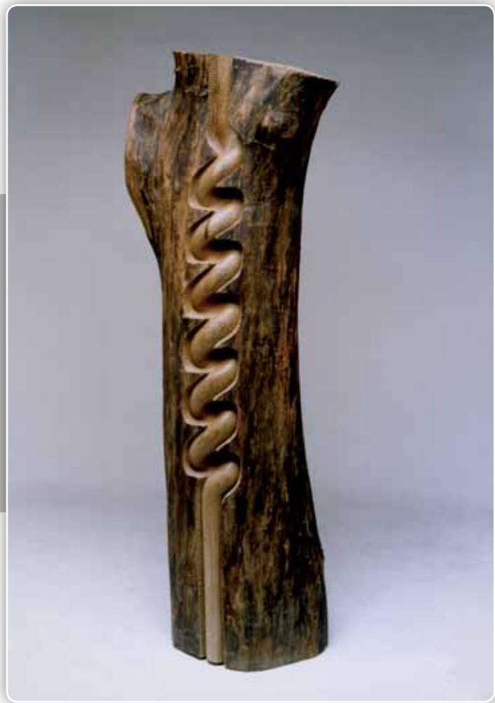
6.- Serie Arbóreas - Madera de nogal - 160x58x30 cm - 1989