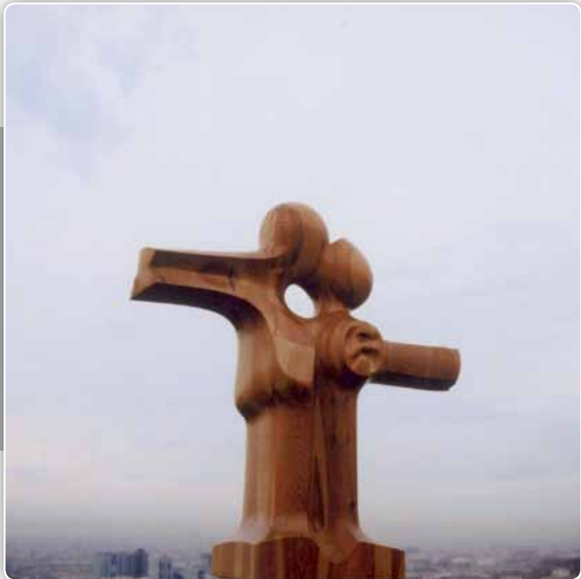
8.- Serie Encuentros - Madera de pino - 240x250x50 cm - 1984