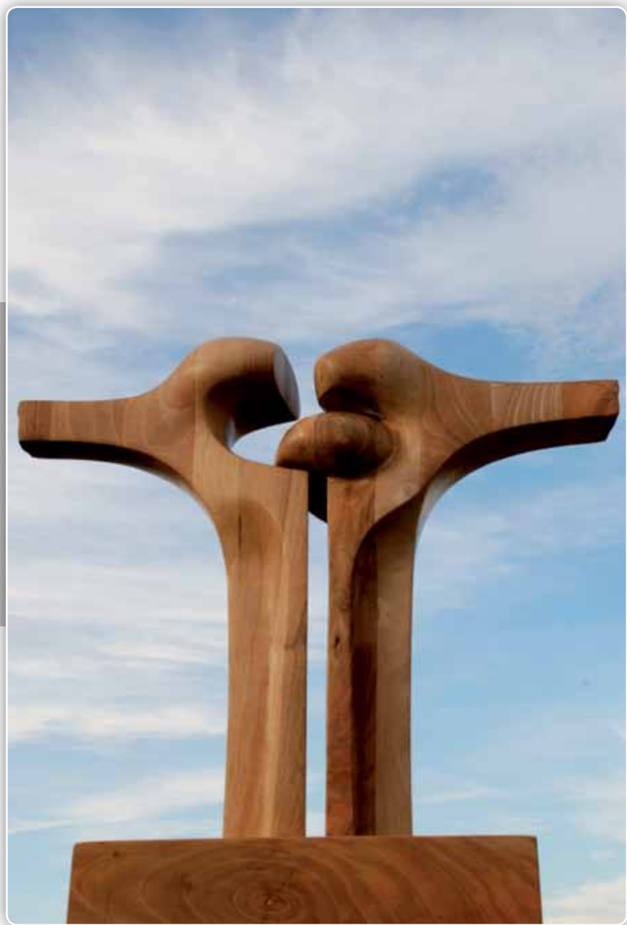
14.- Serie Encuentros - Madera de Danta - 90x90x30 cm - 1996