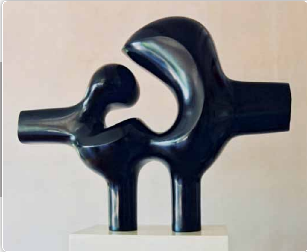
4.- Serie Encuentros - Nogal teñido - 75x75x29 cm - 1982