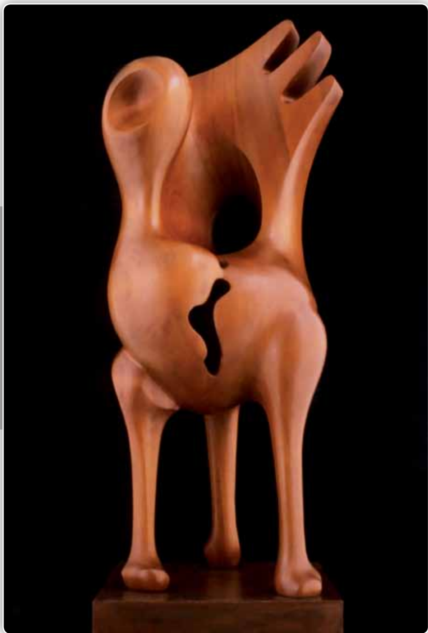
10.- Serie Gallinetas - Madera de caobilla - 118x41x41cm - 1996