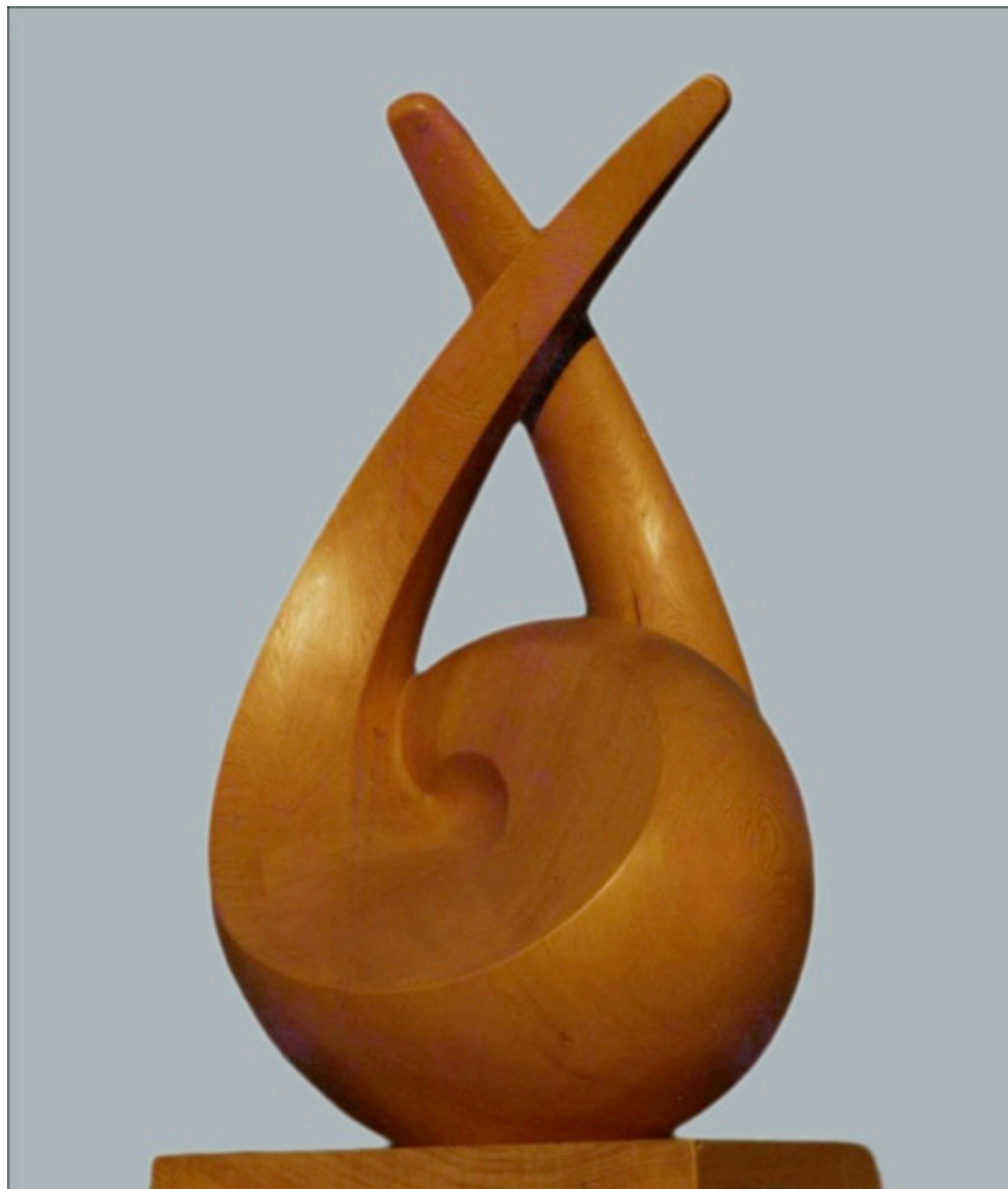
F.340-serie organica 1987 madera